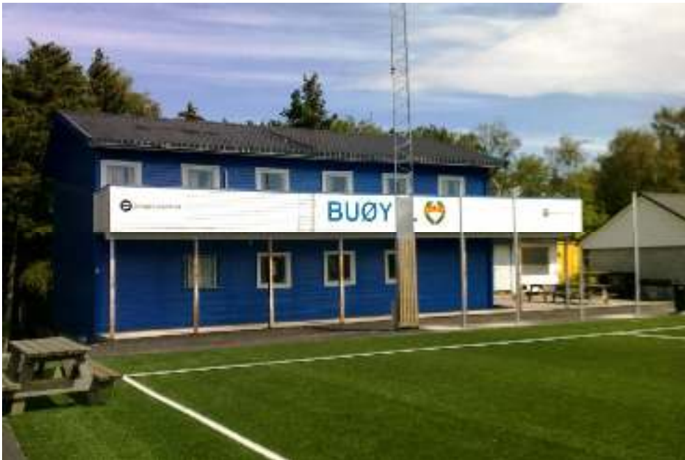
Klubbhuset, mandag 10.Aug klokken 1930.